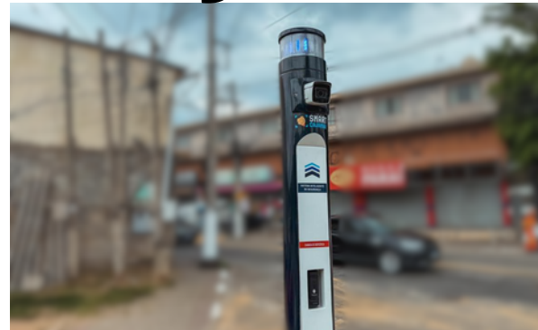
Totens inteligentes reforçam a segurança nos pontos de ônibus em Cajamar