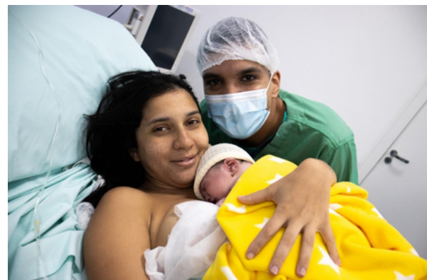
Nascimento reforça o compromisso da unidade em oferecer atendimento humanizado

A equipe multiprofissional esteve presente em todas as etapas do atendimento, garantindo acolhimento, cuidado integral e suporte especializado para a mãe e o bebê. Desde a admissão até o momento do nascimento, cada procedimento foi conduzido com precisão técnica e sensibilidade, refletindo o padrão de qualidade do hospital.