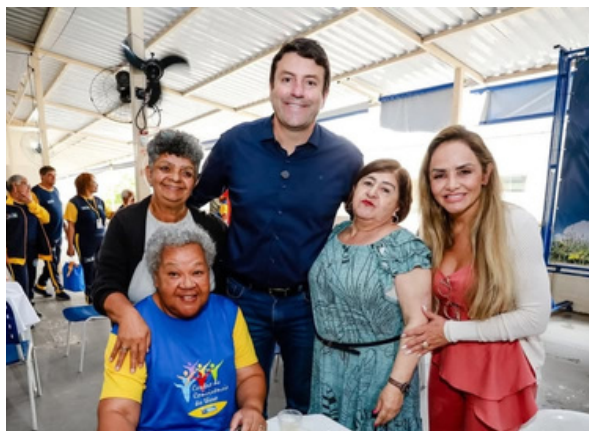
O novo espaço terá como objetivo oferecer um ambiente adequado para o lazer