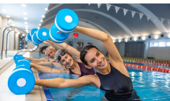
Para se inscrever nas aulas é necessário ter idade mínima de 18 anos

A Secretaria de Esportes e Lazer de Cajamar abriu as inscrições para as aulas de hidroginástica no Conjunto Aquático “Antônio Esparrinha Silva Junior”, no Parque Cajamar Feliz – Jordanésia. Para participar, é necessário ter 18 anos ou mais e apresentar cadastro do Conjunto Aquático, documento de identidade, exame médico dermatológico válido e