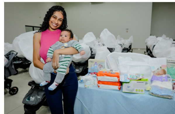
Mamães de Santana de Parnaíba recebem novos kits de enxoval com itens ampliados

A Prefeitura de Santana de Parnaíba realizou a entrega de 107 kits de enxoval do Programa Mãe Parnaibana, durante evento na Arena de Eventos. O programa oferece acompanhamento completo às gestantes, com palestras, atividades físicas adaptadas e atendimentos nutricionais, psicológicos e sociais, visando orientar as futuras mamães e reduzir a mortalidade materna e infantil.