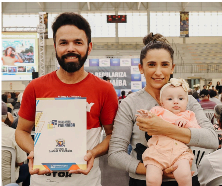
Prefeitura entrega mais 1,5 mil escrituras pelo Regulariza Parnaíba e alcança 10 mil imóveis regularizados em 12 anos

O serviço, totalmente gratuito, já regularizou loteamentos em diversos bairros e representa uma economia de R$ 5 mil a R$ 15 mil para cada beneficiário. Além do ganho financeiro, as famílias passam a ter segurança jurídica, po-